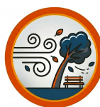
RAJADAS DE VENTO