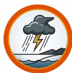
TEMPESTADES PONTUALMENTE INTENSAS