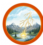
DESCARGAS ELÉTRICAS ATMOSFÉRICAS