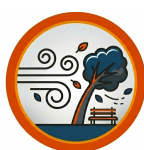
RAJADAS DE VENTO