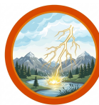
DESCARGAS ELÉTRICAS ATMOSFÉRICAS