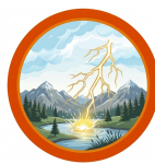
DESCARGAS ELÉTRICAS ATMOSFÉRICAS