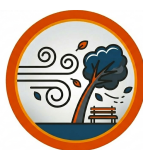
RAJADAS DE VENTO