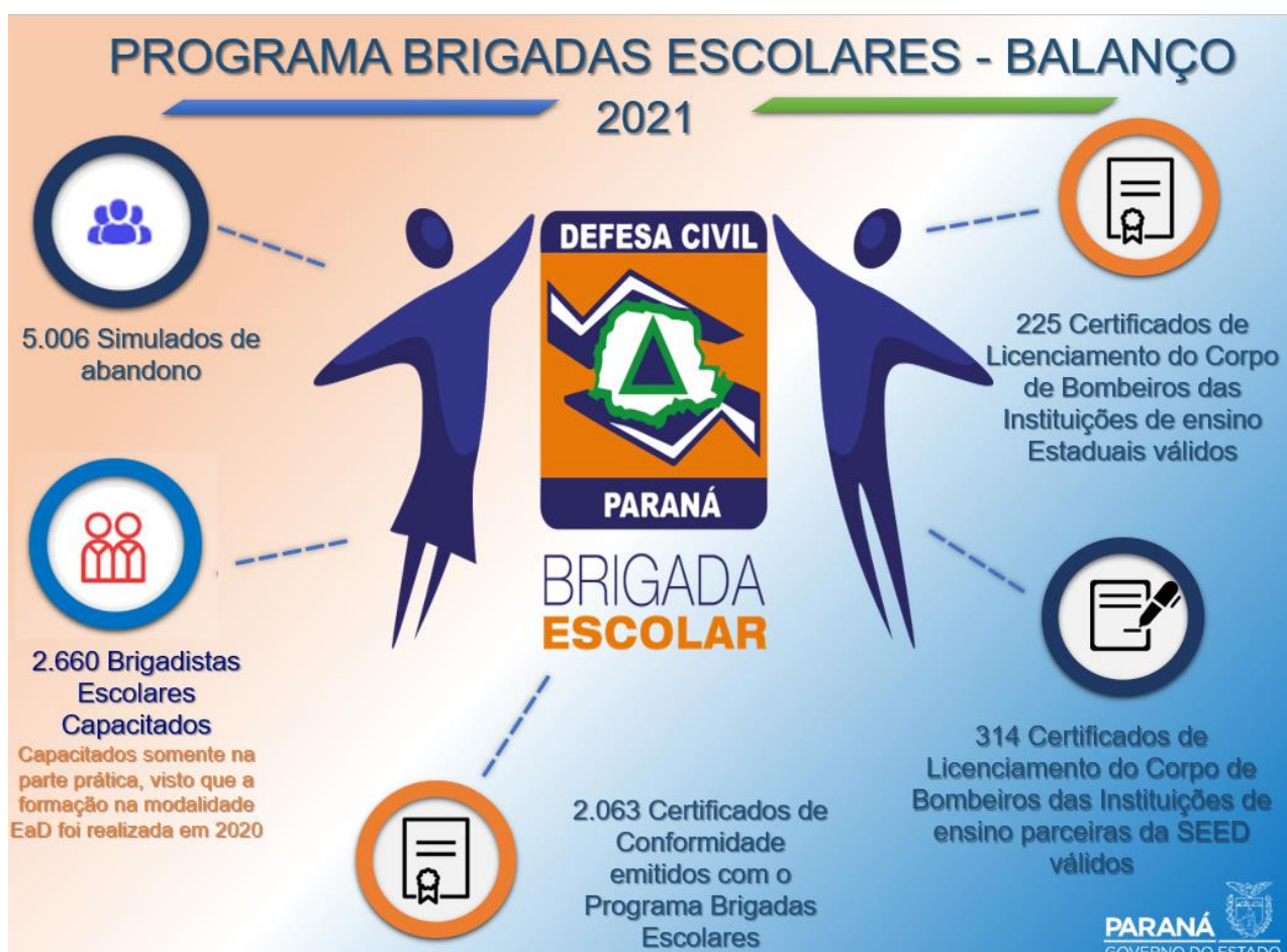
Figura 3 – Ilustração dos números das ações do PBEDCE